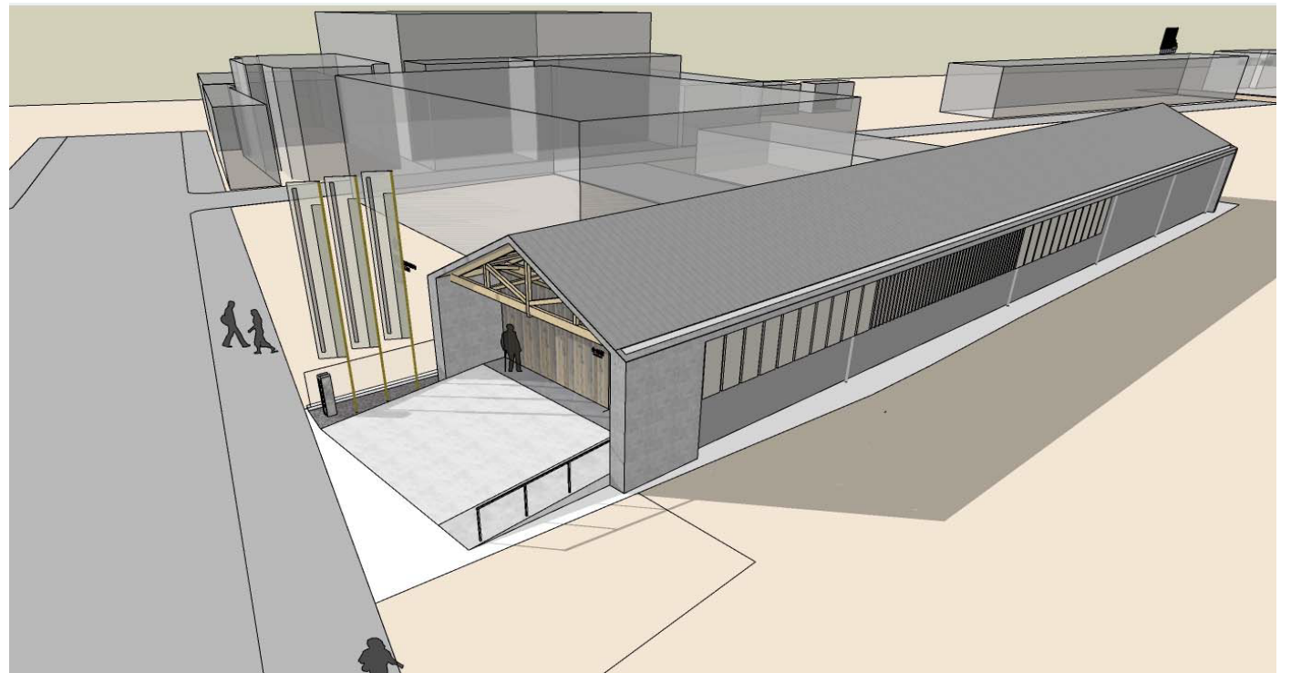
金剛館 外観イメージ